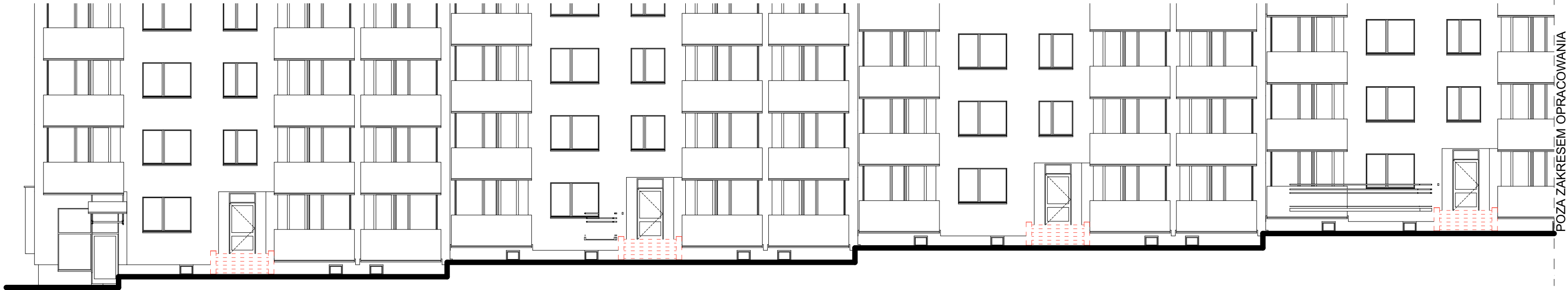
ELEWACJA WSCHODNIA rozbiórki